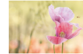
2. Platz 2023: Johanna Burosch