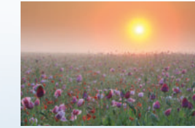
3. Platz 2023: Karin Sass

Sicherlich werden auch Sie den blühenden Mohn im Geo-Naturpark fotografieren. Wir sind sehr gespannt auf Ihre Bilder! Auch wenn die Auswahl schwerfällt, senden Sie uns bitte nur ein Foto pro Person für die Teilnahme an unserem Fotowettbewerb. Geben Sie Ihren Namen im Bildtitel an und senden Sie es bis zum 31. August 2024 per E-Mail mit dem Betreff „Fotowettbewerb Mohn“ an info@naturparkfrauholle.land . Mit Ihrer Einsendung erlauben Sie dem Geo-Naturpark Frau-Holle-Land, Ihr Foto kostenfrei zu verwenden.